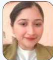
Prof. Katyayni Assistant Professor